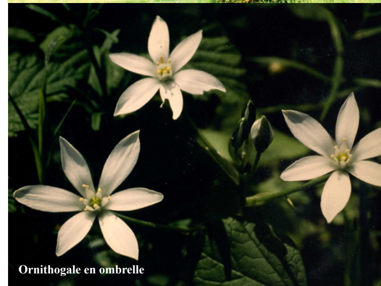
Ornithogale en ombelle