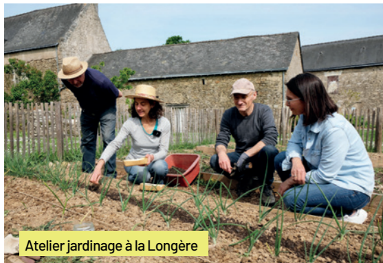
Atelier jardinage à la Longère