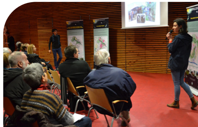
Réunion de restitution sur la réflexion autour du Cours Hermeland menée en 2018 et 2019 // Hôtel de Ville.