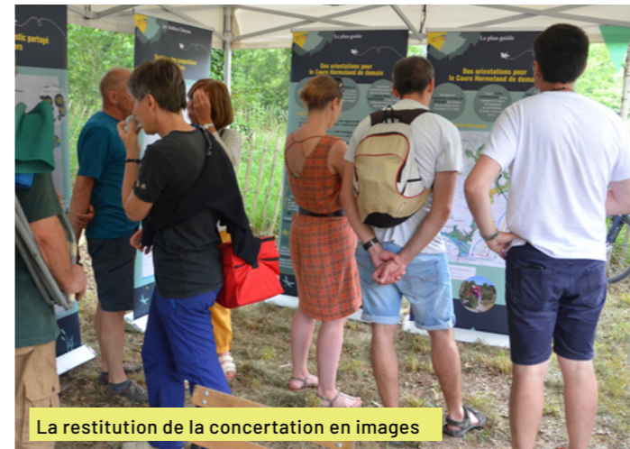
La restitution de la concertation en images

L'événement « Le Cours Hermeland en fête », en juin 2019, parc de la Chézine, est venu clore cette première étape, et une exposition a dévoilé les premiers grands principes, compilés dans un plan guide.