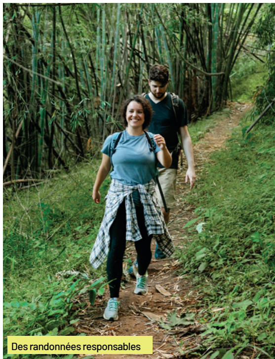
Des randonnées responsables