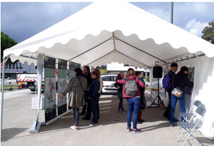
Atelier Parc d'Ar Mor - Zénith - Oct. 2018

Ces nombreux échanges ont permis d'explorer le champ des possibles et de faire des propositions. Elles sont venues alimenter la réflexion des élus et des architectes de l'Atelier UP+.