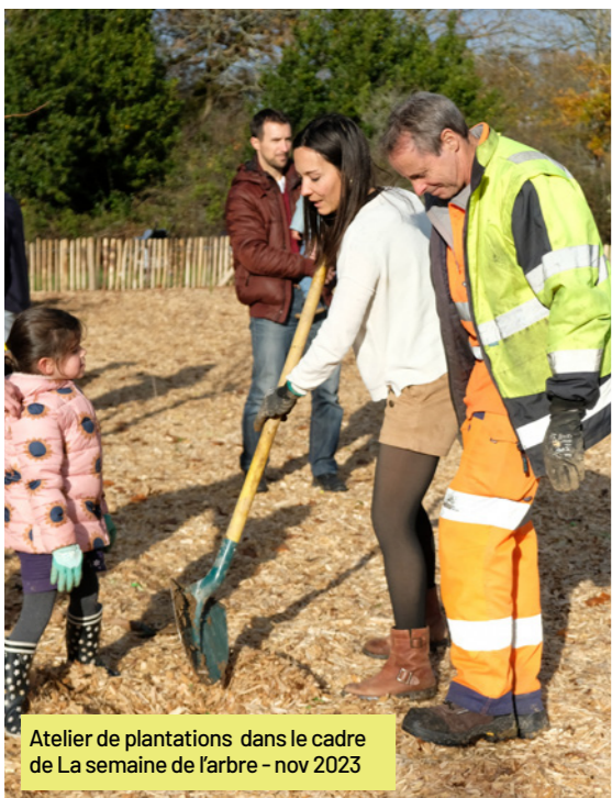
Atelier de plantations dans le cadre de La semaine de l'arbre - nov 2023