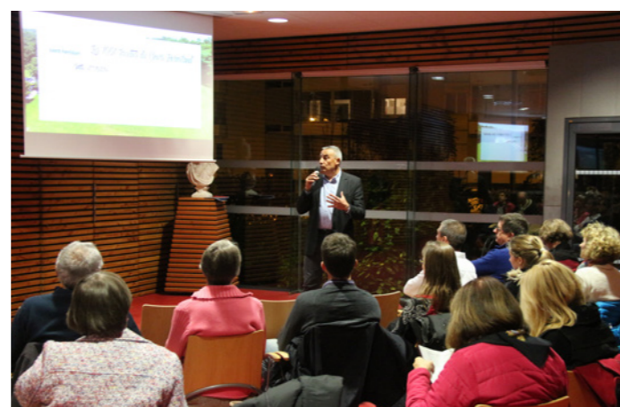
Soirée d'étape concertation. «Construisons ensemble un projet pour le Cours Hermeland de demain » - Hôtel de Ville - 14 nov. 2018

L'événement « Le Cours Hermeland en fête », en juin 2019, parc de la Chézine, est venu clore cette première étape, et une exposition a dévoilé les premiers grands principes, compilés dans un plan guide.