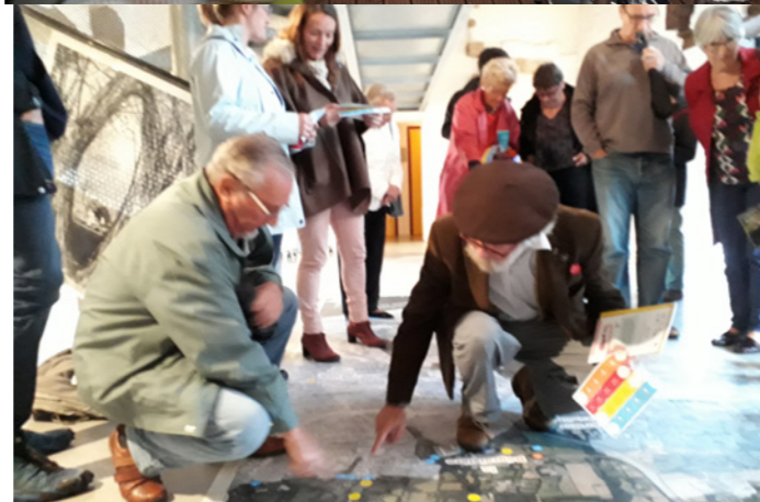
Lancement de la concertation. «Construisons ensemble un projet pour le Cours Hermeland de demain » - Bégrenaisière - 6 oct. 2018