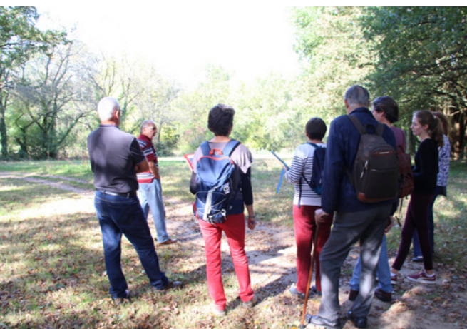
Atelier Chézine - Oct. 2018