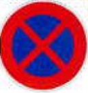
B6d Arrêt et stationnement interdits

accès du chemin piédestre et afin d'améliorer les conditions de demi-tour des véhicules de services et notamment de la collecte des ordures ménagères.